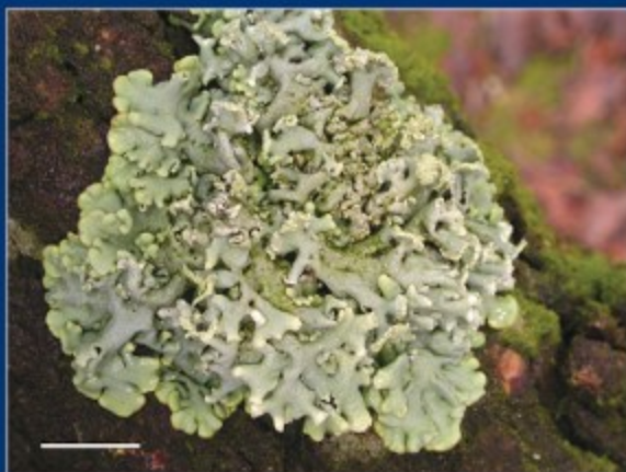
C Gewoon schorsmos - Hypogymnia physodes een grote, grijze, bladvormige soort met bolle lobben. Vaak met hoopjes poeder en zwarte spikkels.