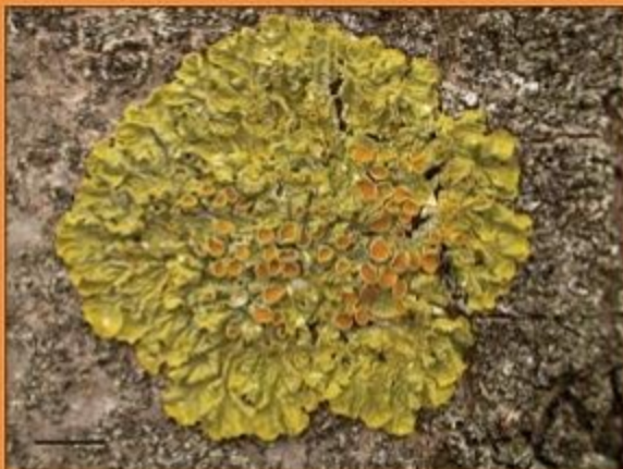
A Groot dooiermos - Xanthoria parietina een grote, gele, bladvormige soort met opvallende oranje vruchtlichamen.