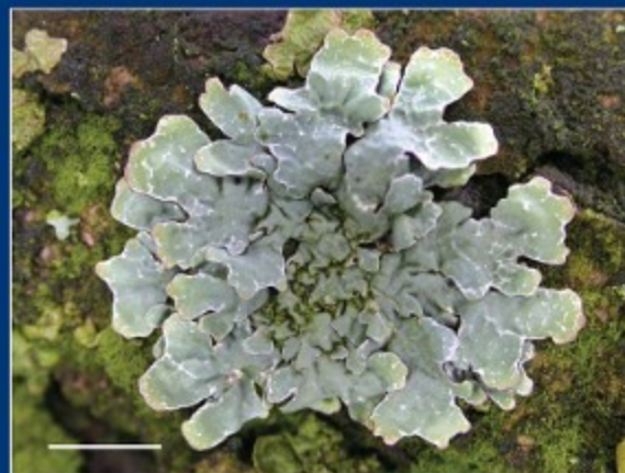
C Gewoon schildmos - Parmelia sulcata een grote, grijze, bladvormige soort met dunne, platte lobben met witte strepen en stippen.