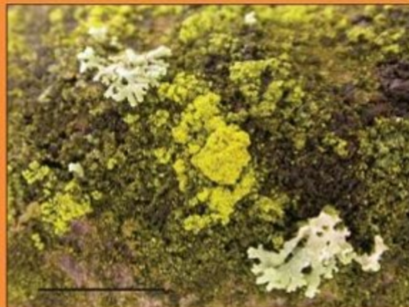
A Poedergeelkorst - Candelariella reflexa een knalgele, korstvormige soort die vaak in brede, verticale banen langs de stam groeit.