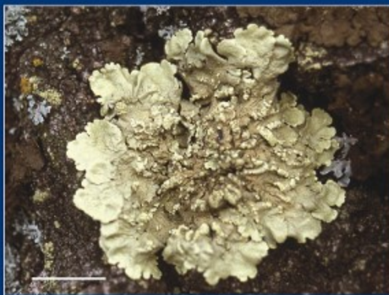
C Bosschildmos - Flavoparmelia caperata een grote, grijsgroene, bladvormige soort. In het midden met poederige plekken.