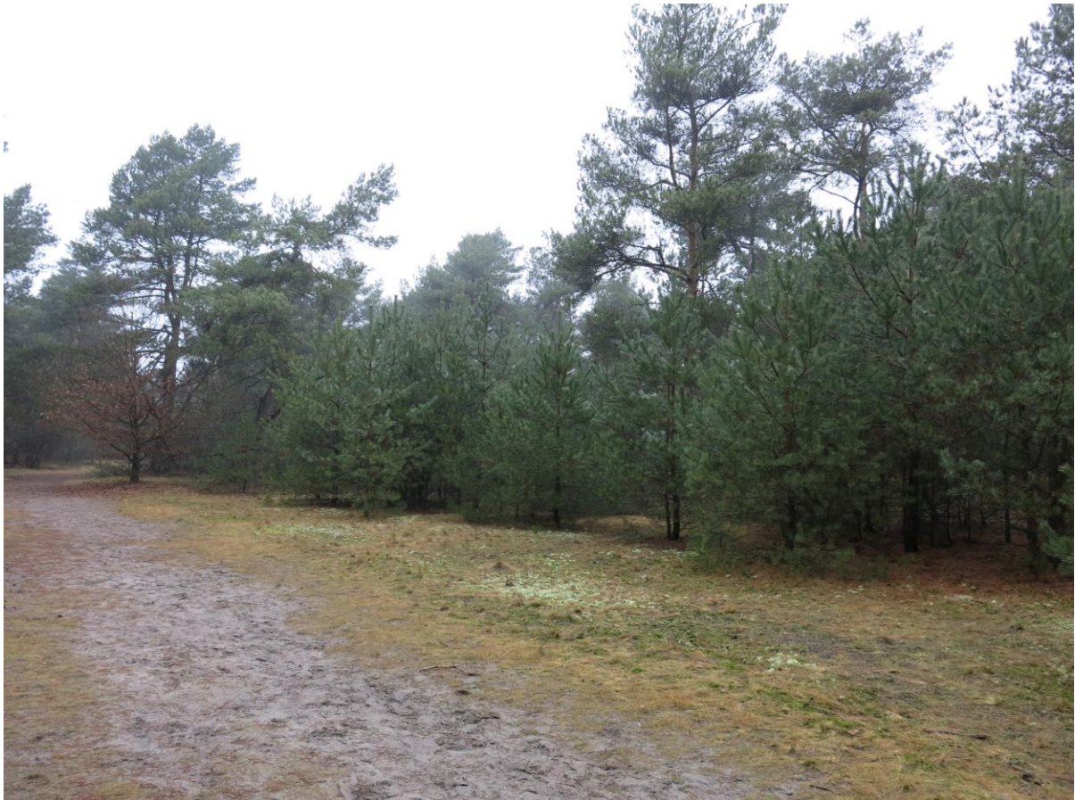
Meetpunt Kootwijkerzand 1.

In dit rapport staat de nieuwe methode beschreven samen met de eerste resultaten van het veldonderzoek in meetrunde 2013.