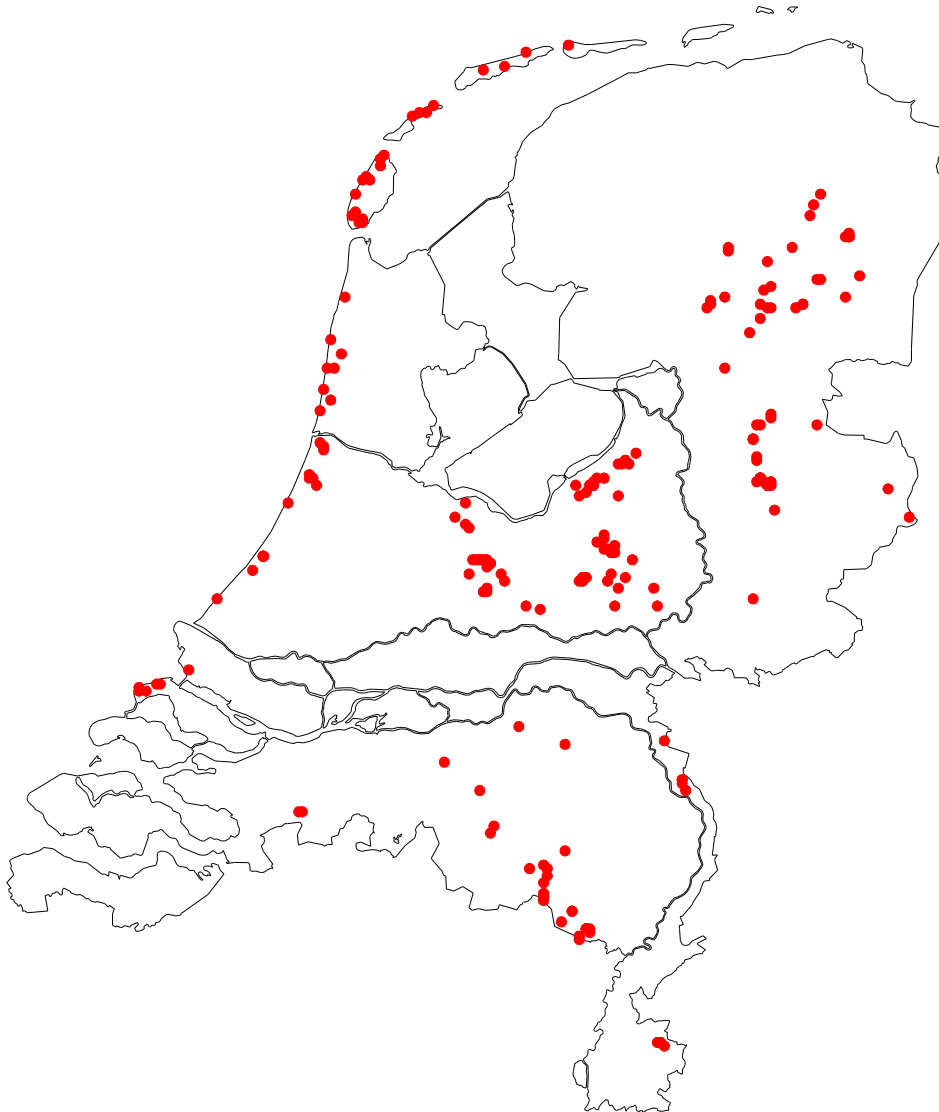
Figuur 2. De steekproef van kilometerhokken voor het meetnet.