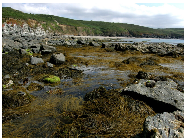
Kust bij Keneggy Cove