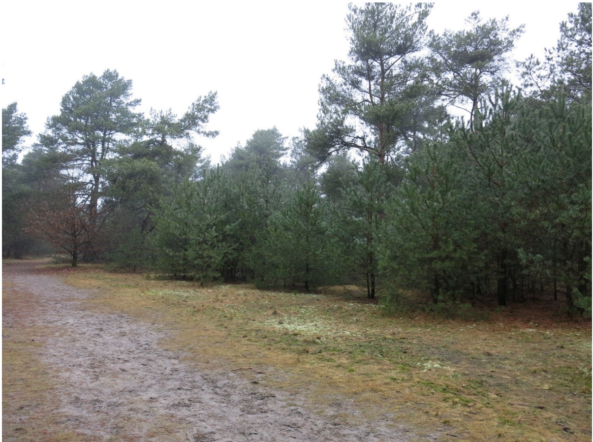
Meetpunt Kootwijkerzand 1.

In dit rapport staat de nieuwe methode beschreven samen met de resultaten van het veldonderzoek in meetronde 2015.